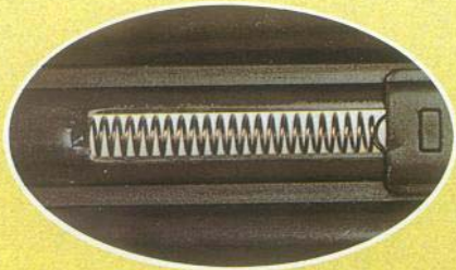
Cliquet de Sécurité

du Uzi de continuer à tirer en présence de sable, poussière et d'eau en a fait l'étalon servant à juger les autres armes. Le Uzi a été conçu pour être manoeuvré aussi aisément par les gauchers que par les droitiers. Pour le rendre encore plus versatile des chargeurs standards de 20, 25 et 30 cartouches sont disponibles.