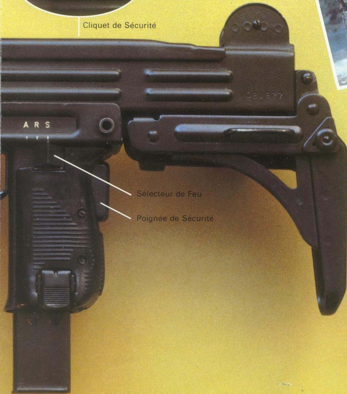
Sélecteur de Feu